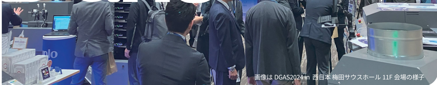
画像は DGAS2024 in 西日本 梅田サウスホール 11F 会場の様子